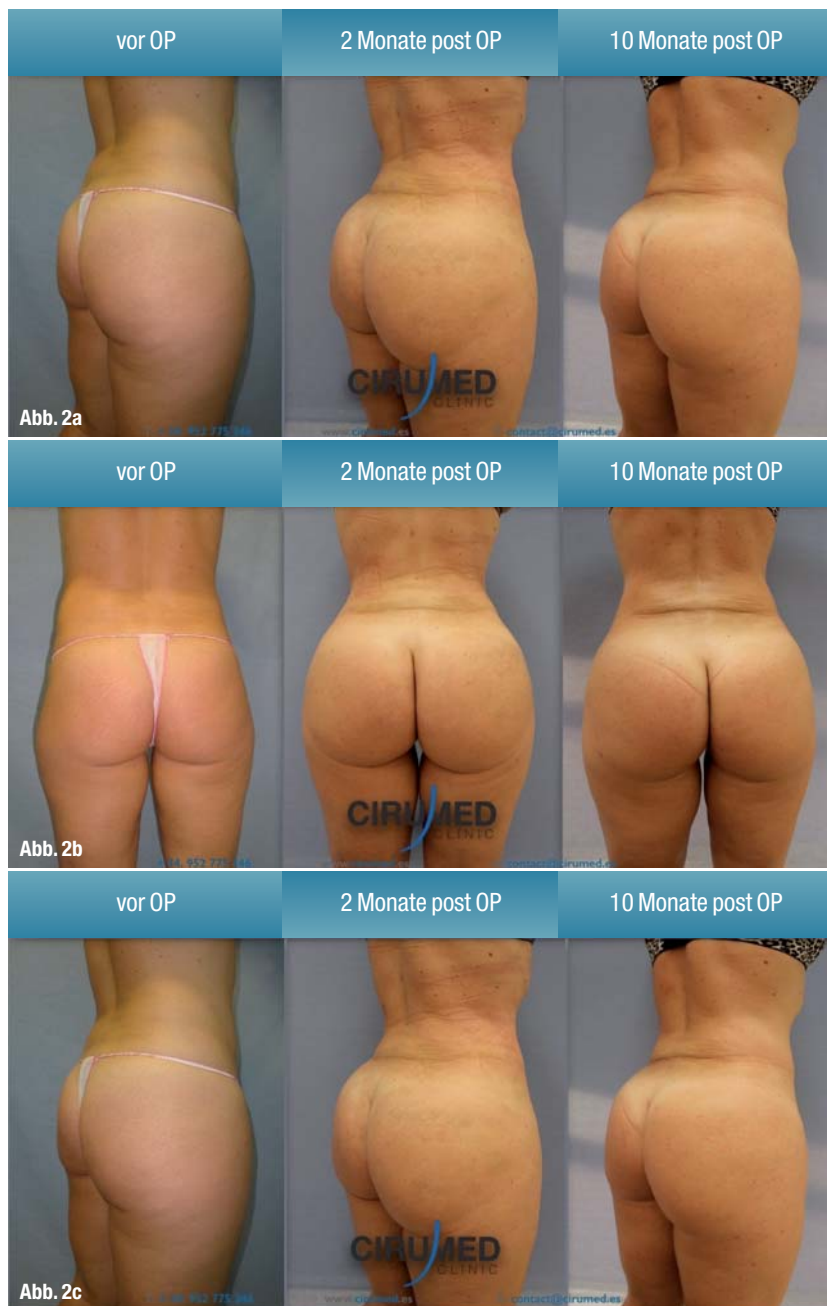
Abb. 2a–c: „Brazilian Butt Lift“ mit 950 cc Transplantationsvolumen pro Seite, Ergebnis nach zwei bzw. zehn Monaten mit gleichbleibendem Volumen.

dabei hält das System den Ansaugdruck automatisch unter 350 mmHg. Typische Einsatzbereiche für die Fettabsaugung sind der Bauch (Abdomen) sowie Rücken und Flanken („Fettpölsterchen“). Die Modellierung dieser Zonen verbessert deutlich das ästhetische Ergebnis. Das body-jet-System ist mit einem Filter („Lipocollector“) verbunden, welcher das Fett und das fibröse Gewebe trennt; auf diese Weise wird direkt transplantfähiges Fett erstellt. In seinem ursprünglichen Konzept erfordert der Lipocollector keine weitere Bearbeitung des extrahierten Fetts, jedoch haben die Autoren das Lipocollector-Protokoll modifiziert. Obwohl es den Lipocollector-Protokollen nach nicht unbedingt erforderlich ist, erhalten sie durch die manuelle Zentrifugation